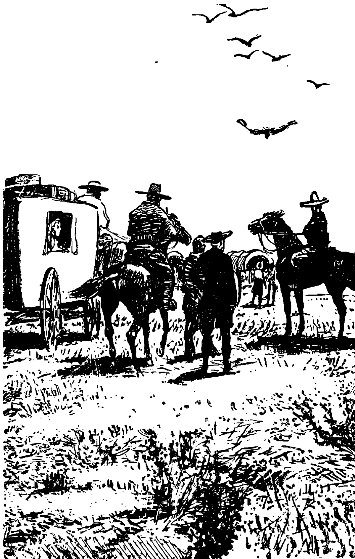
Прекрасный породистый гнедой конь. Самому арабскому шейху не стыдно было бы сесть