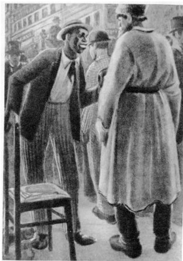
Худ. В. Владимиров.